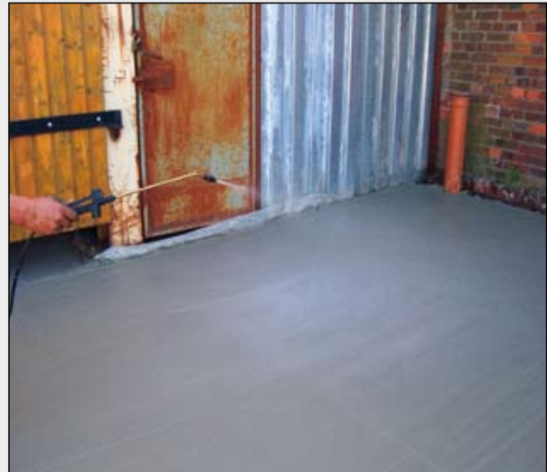
Verarbeitung wahlweise im Streich-, Roll- oder Spritzverfahren auf Frischbeton